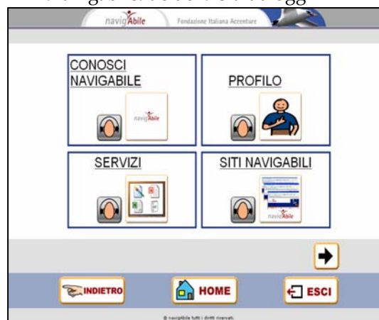
Home page versione NavigAble del sito www.navigabile.it

I servizi di comunicazione (tabella di comunicazione, compositore frasi, mail, bacheche tematiche e per community), si sono anch'essi via via arricchiti di funzionalità e sono attualmente utilizzati con continuità da circa 1.500 utenti su tutto il territorio nazionale. NavigAble ha ottenuto, nel mese di ottobre 2005, un importante riconoscimento, l'European Sponsorship Award, vincendo il primo premio nella categoria “sociale ed educazione”.