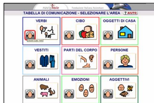
Tabella di comunicazione per utenti che utilizzano CAA

I servizi di comunicazione (tabella di comunicazione, compositore frasi, mail, bacheche tematiche e per community), si sono anch'essi via via arricchiti di funzionalità e sono attualmente utilizzati con continuità da circa 1.500 utenti su tutto il territorio nazionale. NavigAble ha ottenuto, nel mese di ottobre 2005, un importante riconoscimento, l'European Sponsorship Award, vincendo il primo premio nella categoria “sociale ed educazione”.